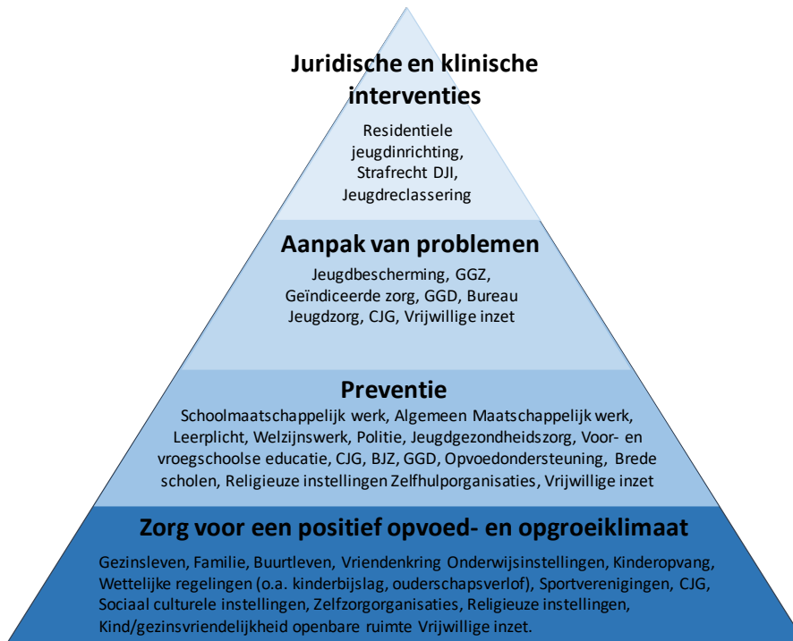
Figuur 1: de interventiepiramide

In de notitie jeugdbeleid wordt gesteld dat in deze notitie geen thema's over jeugdzorg en jeugdhulp worden behandeld. De interventiepiramide maakt een onderscheid tussen vier domeinen waarop interventies zich kunnen richten vanaf "zorg voor een positief opvoed- en opgroei-klimaat" tot en met de "juridische en klinische interventies", zie figuur 1.